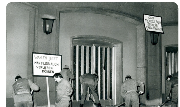
BStU, MfS, BV Rostock, Abt. XX, Nr. 1534